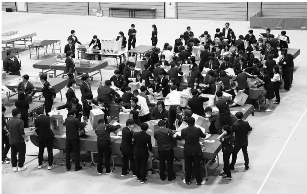
東北ヒロセシーアリーナ（市民総合体育館）で行われた開票作業の様子