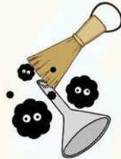
ロート清掃 端材ウレタン分別