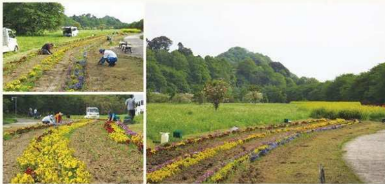
展勝地(北上市)に植えられた100メートルを超える長さのパンジー畑