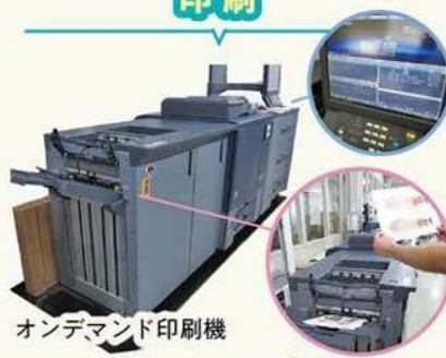
オンデマンド印刷機