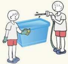
プラスチックカートン洗浄