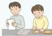
マスキングシール貼り