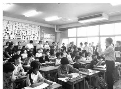
進んで発言する山口小児童