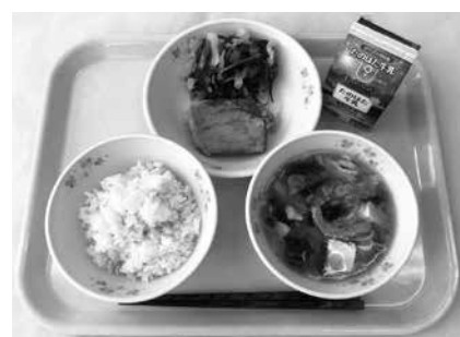
宮古っこ給食（9月22日献立）

給食センターでは、今後もより多くの宮古産食材を活用し、安心・安全な給食を届けることで、子どもたちの笑顔がさらに広がるような取り組みを進めていきます。