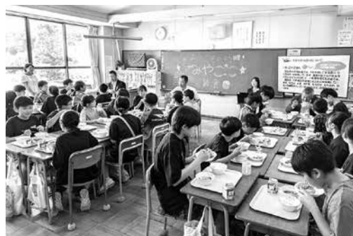
千徳小学校6年2組の給食風景