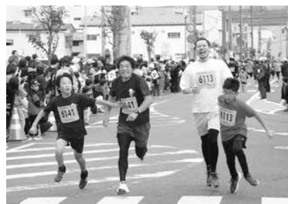
手を取り合って、笑顔でラストスパート