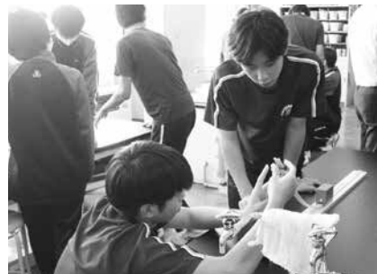
実験に取り組む津軽石中生徒

両校とも、子どもたちが自分の疑問に向き合い、友達と話し合いながら解決に取り組む姿が見られました。「みんなで宮古の子どもを育てる」という思いを新たに、貴重な機会となりました。