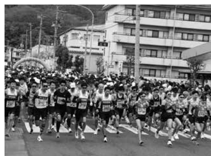
スタートの瞬間、全員が主役！