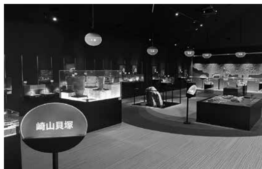
ミュージアム常設展示室の様子

「貝塚」や「縄文土器」などの専門用語は、用語集などを活用して翻訳しています。たとえば、「崎山貝塚」は