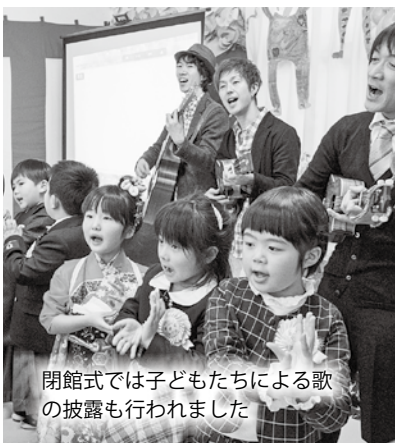
閉館式では子どもたちによる歌の披露も行われました