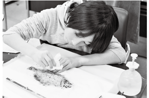
細部にまでいい色を付けました