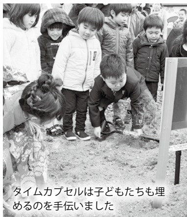
タイムカプセルは子どもたちも埋めるのを手伝いました

式終了後は園庭で卒園児たちによる「たろう太鼓」の披露と希望の風船飛ばしが行われました。また田老野球場の駐車場でタイムカプセルも埋められました。タイムカプセルには12年後の自分に宛てた子どもたちの手紙や子どもたちに宛てた保護者の手紙が入っています。タイムカプセルは卒園児が高校を卒業する12年後に開けられる予定です。