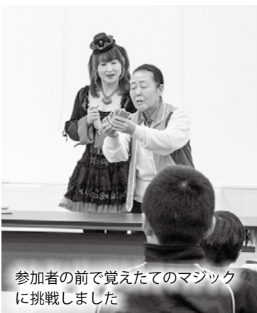
参加者の前で覚えたてのマジックに挑戦しました

マジシャン体験では紙コップやトランプカードを使ったマジックを体験しました。参加者はマジックのコツなどをしっかりと聞き、他の参加者の前で実演していました。マジシャン体験に参加した小学生は「自分でマジックをするのは初めて。カードのマジックが楽しかった。家族や友達に見せたい」と満面の笑顔で話していました。