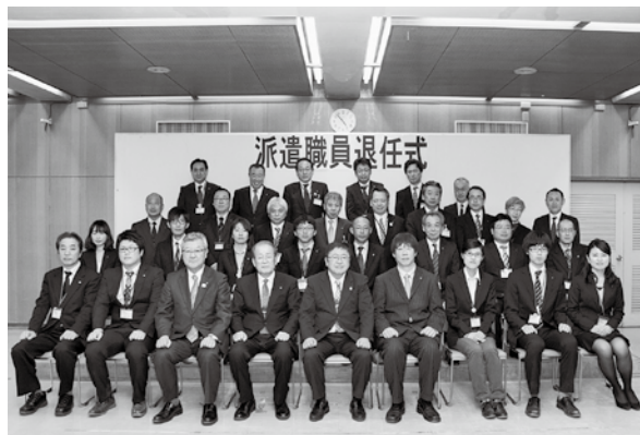
たくさんの派遣職員の皆さんにお世話になりました