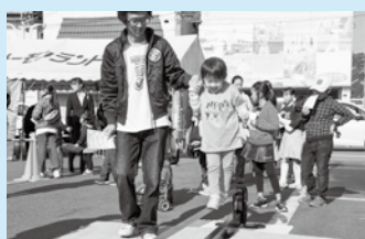
昨年のイベントの様子(末広町)