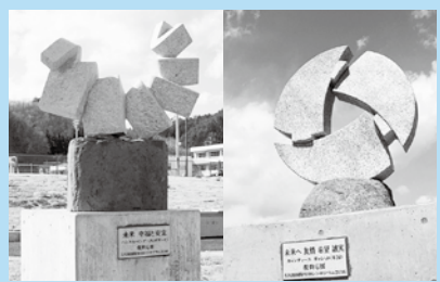
(左) 田老第一中学校前の公園に設置された「未来 幸福と安定」ハンス・レインダース作 (オランダ彫刻家) (右) 宮古運動公園に設置された「未来へ 友情 希望 誠実」キャンディース・ギャレット作 (アメリカ彫刻家)

5大陸国際彫刻シンポジウム実行委員会から寄贈された復興支援彫刻の寄贈式が4月12日・13日、田老第一中学校前の公園と宮古運動公園駐車場で行われました。寄贈された彫刻は同実行委員会代表で兵庫県在住の彫刻家、