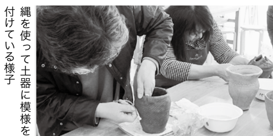
縄文生活体験の様子