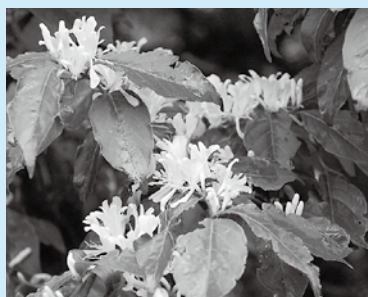
ハナヒョウタンボクの花

スイカズラ科のハナヒョウタンボクは氷河期の遺存植物で、現在岩手県と長野県でしか確認されていない貴重な植物です。