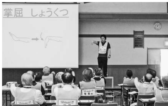
昨年度の講習会(理学療法士による講義)の様子