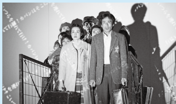
「ハンナのかばん」のワンシーン