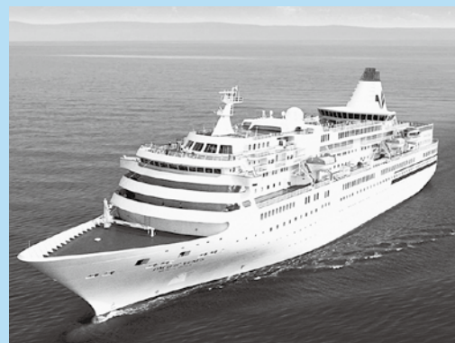
海上を進む客船「ぱしふいっくびいなす」