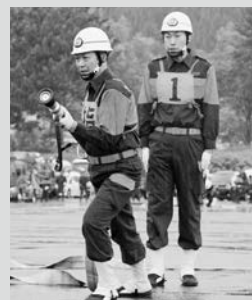
消防操法の訓練を行う消防団員(昨年の大演習より)