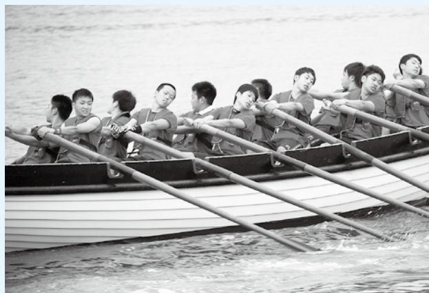
息を合わせ全身を使ってオールをこぐ選手たち