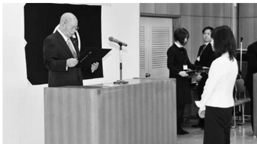
4月23日に行われた当選証書付与式

4月22日に行われた宮古市議会議員一般選挙で当選した22人は次の方々です（得票数順・敬称略）。