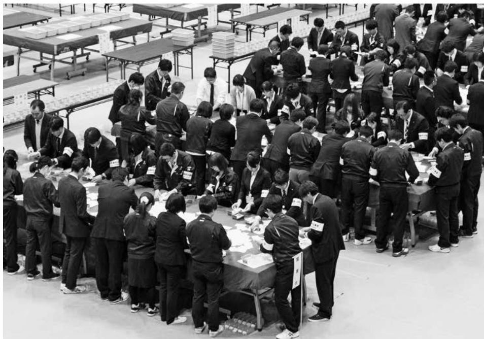
市民総合体育館で行われた開票作業の様子