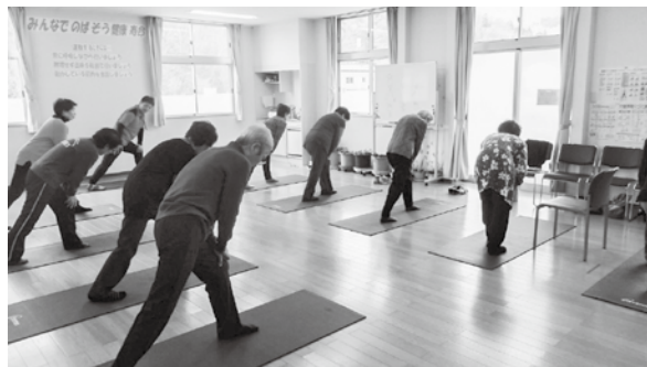
簡単な運動から始めるので無理せず参加できます