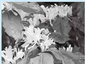
ハナヒョウタンボクの花

スイカズラ科のハナヒョウタンボクは氷河期の遺存種で、現在は岩手県と長野県でしか確認されていない貴重な植物です。日本一とも言われている巨木をはじめ、6月のわずかな時期に無数の花をつけるハナヒョウタンボクの観察会を行います。