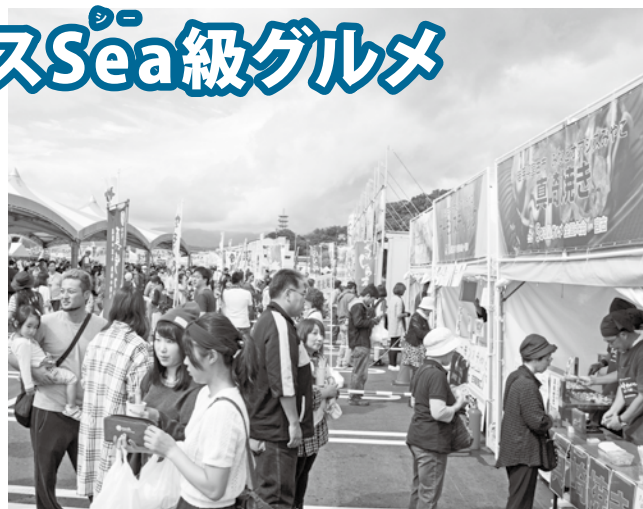
平成27年に宮古市で行われた「第6回みなとオアシスSea級グルメ全国大会」の様子。今回行われるのは第1回東北大会