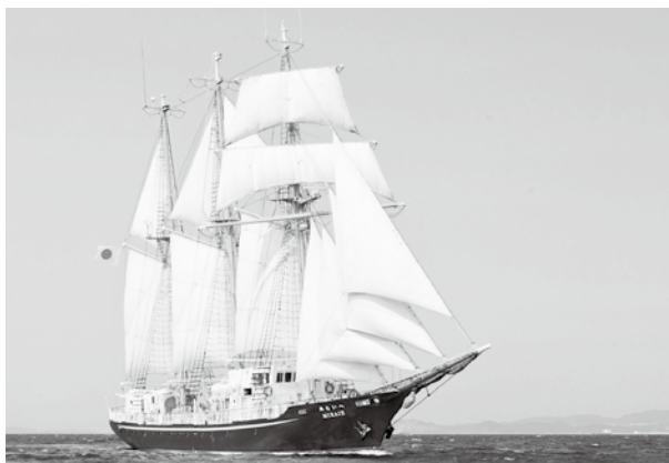
宮古へは3度目の寄港となる帆船「みらいへ」(230ト、全長約52m)