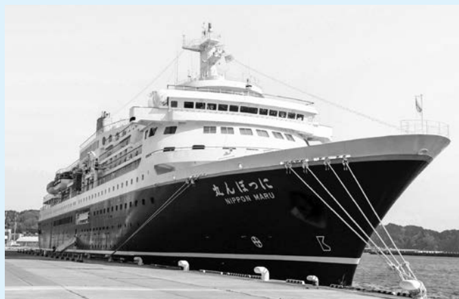
本年4月22日に寄港した際の様子