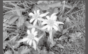
ハヤチネウスユキソウ (撮影：武内悦子)

※ミニ企画展を6月1日(火)～30日(水)午前9時～午後5時まで開催中です。詳細は26頁をご確認ください