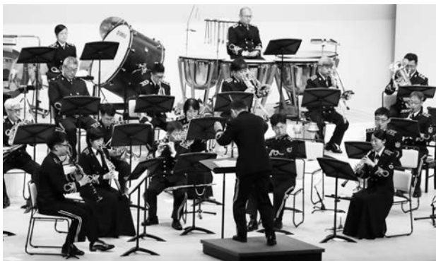
海上自衛隊大湊音楽隊30人は「東京オリンピック・ファンファーレ&マーチ」や「銀河鉄道999-Jazz Ver.-」を披露しました