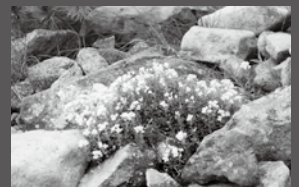
ナンブイヌナズナ