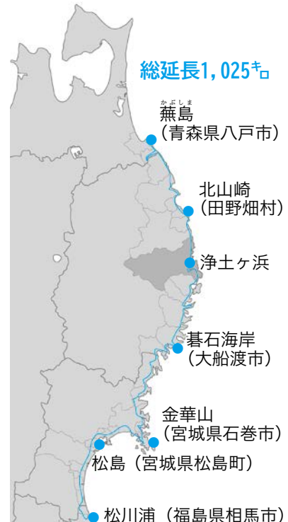
みちのく潮風トレイルルート(緑線)と主なスポット