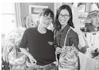
令和2年6月の様子。今後も宮古を探索したいです！

空き家サポートブック 空き家に関する仕事を するようになってから 思うことがありま す。それは、 空き家に関わ