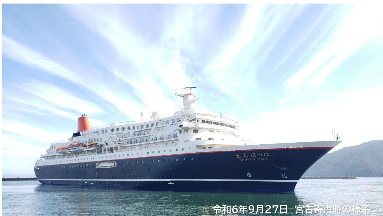
令和6年9月27日 宮古寄港時の様子