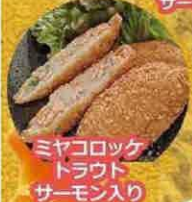
ミヤコロックトラウトサーモン入り