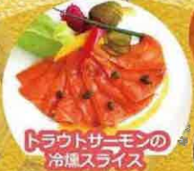
トラウトサーモンの冷燻スライス