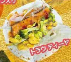
トラウトステーキ