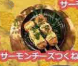
サーモンチーズつくね串