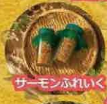
サーモンふれいく