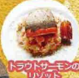
トラウトサーモンのリゾット