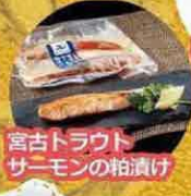
宮古トラウトサーモンの粕漬け