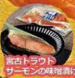
宮古トラウトサーモンの味噌漬け