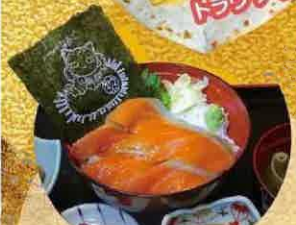
道の駅みやこピアなど内レストラン 汐菜